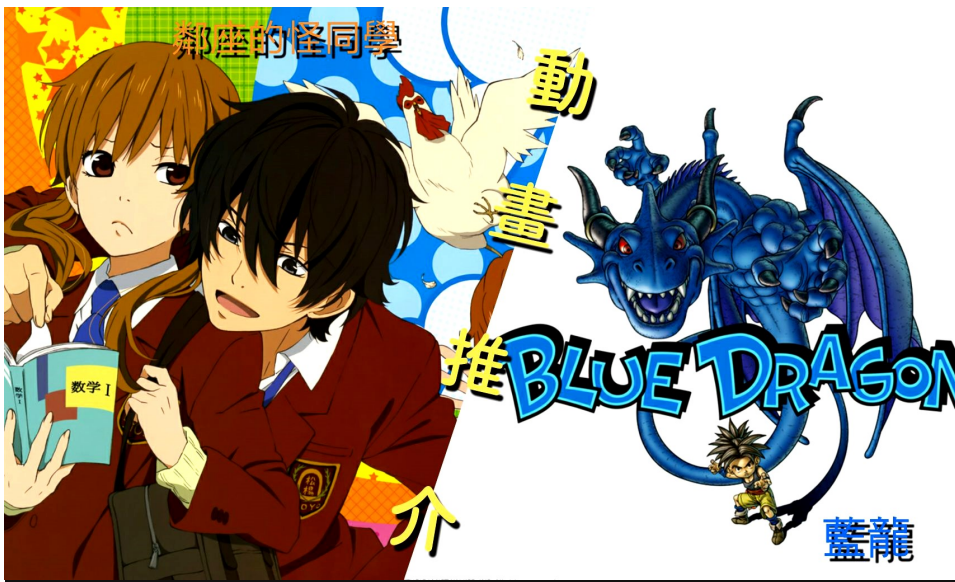
圖片設計: Pson Lam