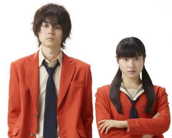
真人電影